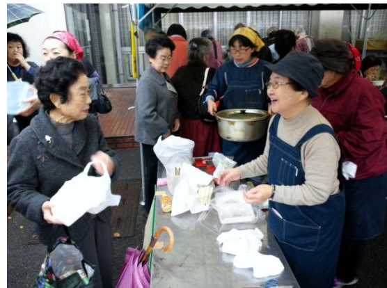
今年も大人気！おでん！商工会女性部