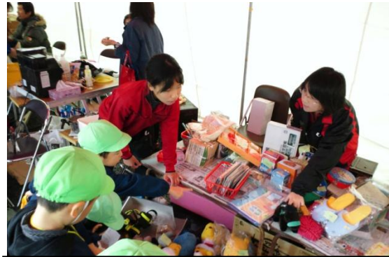
高校生だけじゃない！中学生も頑張ってくれました。