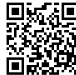
バザー券注文フォーム

※バザー券は前売り制です。琴平社協までご連絡ください。 7/11 まで切 ふれあいデー最後に花火をします！