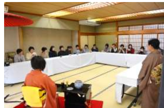
お茶席はイス席です！